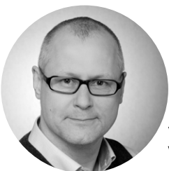
von Dietmar Raupach Verkauf Nord-Deutschland